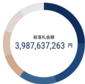
入札傾向 (形式別案件数)