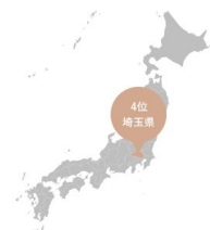
エリア別落札案件数