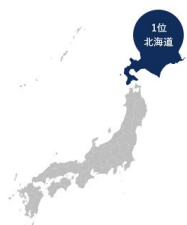
エリア別落札案件数